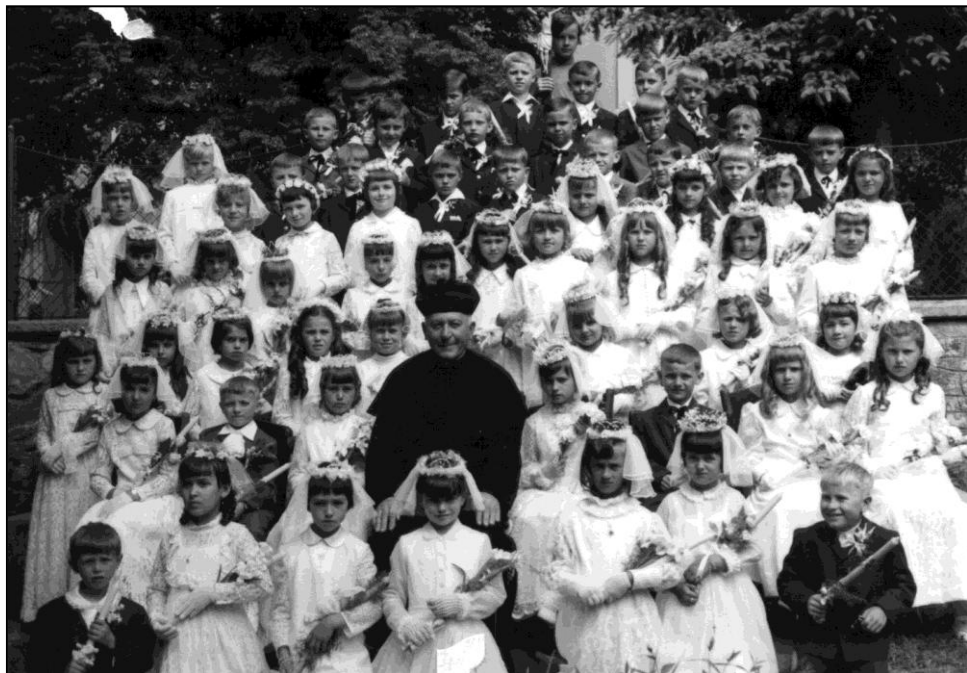
medzi prvoprijímajúcimi deťmi, r. 1971

Kostol si držal vždy vo vzornom poriadku a nebolo roka, aby v ňom niečo nezdokonalil a neobnovil. So svojimi farníkmi vychádzal dobre a bol pre všetkých ako láskavý a milujúci otec. Veľmi mal rád deti a najradšej mal nezbedníkov. Vždy mal dosť miništrantov, ktorých za odmenu brával so sebou v lete na dovolenku do svojej rodnej Habovky. Miloval svoju rodnú dedinu, ale doma sa cítil v Suchej nad Parnou. Za tie roky čo tu bol