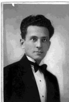
GYÖRJ & BOROS KOŠICE-KASSA