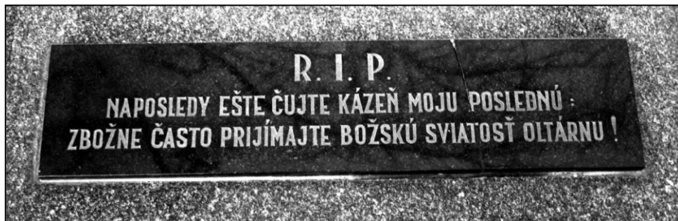
epitaf z náhrobného kameňa, cintorín v Suchej nad Parnou

Spracované podľa: Historia Parochialis Ecclesiae Habovkaensis