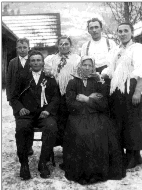
s matkou a súrodencami - druhý sprava